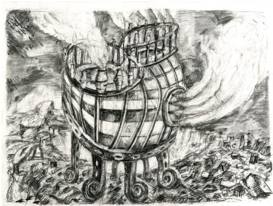
Daniel Flammer, La machine à fumée , 2015, pierre noire, fusain et graphite sur papier, 50 x 65 cm