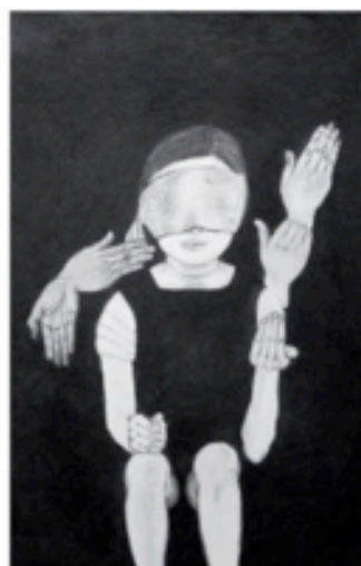
Ayako David-Kawachi Le Christ aux outrages, 2012 Fusain et pierre noire sur papier, 100 x 79 cm GALERIE POLAD-HARDOLIN (ouverture novembre 2013)

Non. Pas plus que l'usage de la mine de plomb, du fusain, voire de la pointe d'argent... Ce n'est pas tout d'avoir ces outils à disposition, encore faut-il savoir les