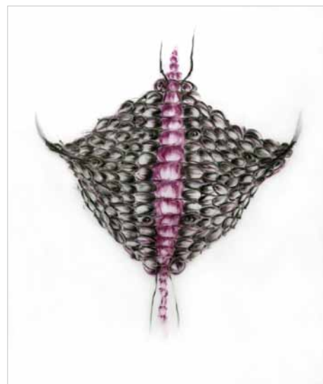
Mákhi Xenakis: Grande métamorphose pastenague, 2012, 110 x 90 cm

Concrètement, il n'y aura rien d'accroché aux murs, qui doivent être démolis. Il reste cinq rangées de rails, qui sont recouvertes de grandes tables de 40 sur 1,4 m. Ainsi, quand on arrive dans l'exposition, le spectateur ne perçoit que le reflet des vitrines protégeant les tables et les dessins disposés dessus.