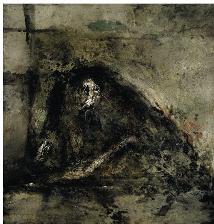
Stani Nitkowski La main amie, 1998 76 x 60 cm