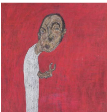
Sabhan Adam Sans titre, 2003 148 x 161 cm

Horaires d'ouverture: du mardi au samedi, de 11 heures à 19 heures